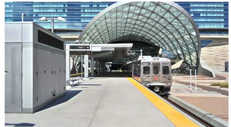
デンバー空港からのRTD Light Rail