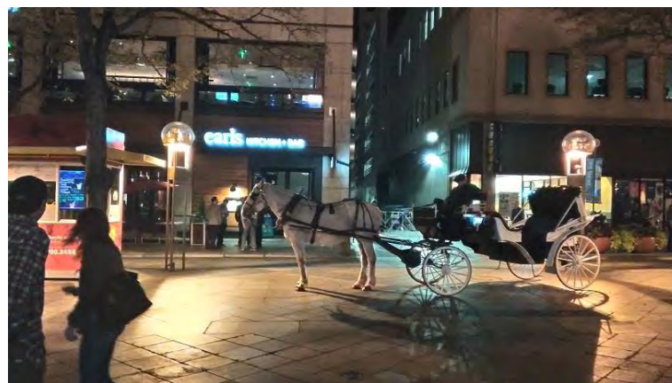
目抜き通りの馬車サービス