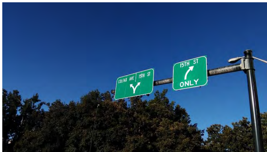
州会議事堂近くの交差点より