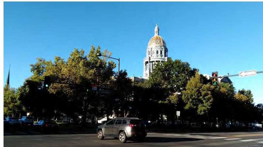
コロラド州会議事堂