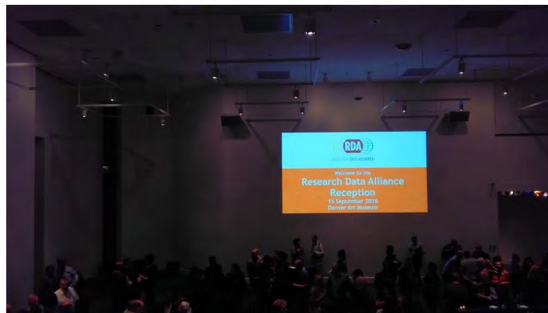
RDA総会レセプション（デンバー美術館）